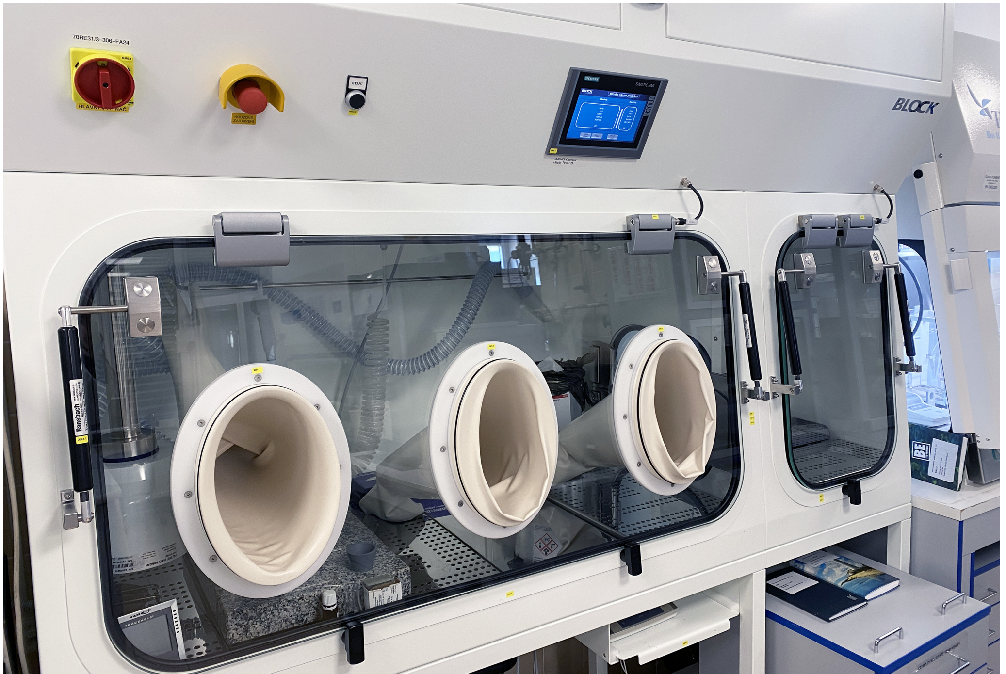
Safety Weighing Box | Teva Czech Industries s.r.o. | Czech Republic