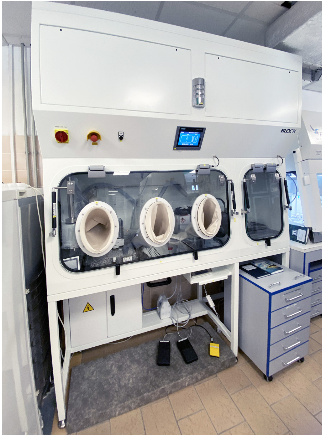
Safety Weighing Box | Teva Czech Industries s.r.o. | Czech Republic