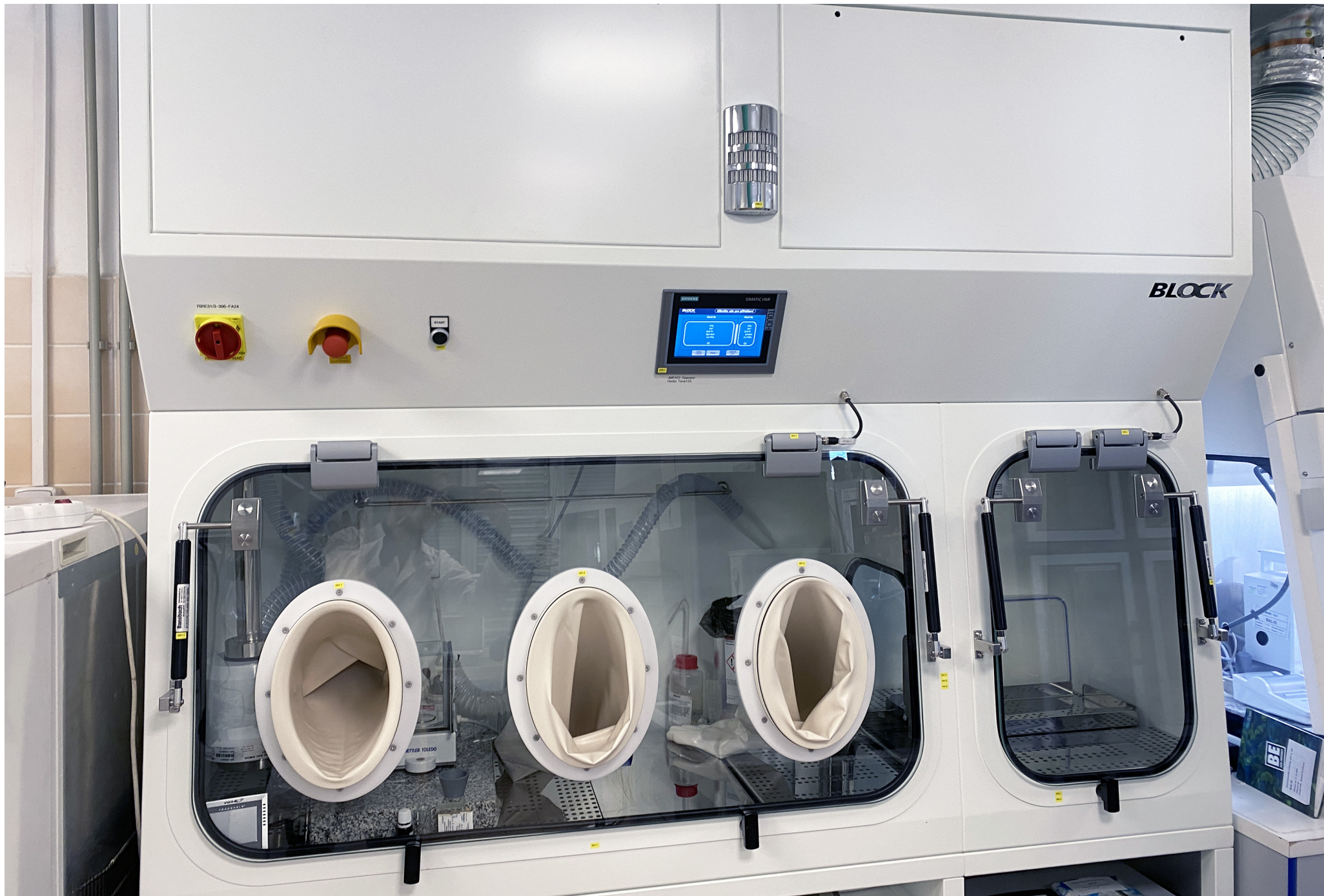
Safety Weighing Box | Teva Czech Industries s.r.o. | Czech Republic