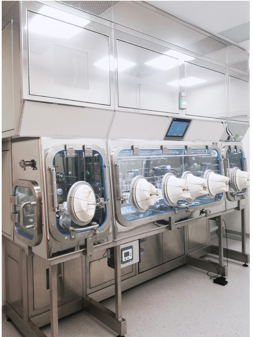
Sterility Test Isolator | FORT LLC | Russia