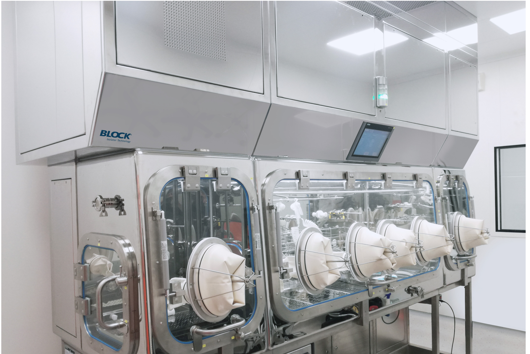
Sterility Test Isolator | FORT LLC | Russia