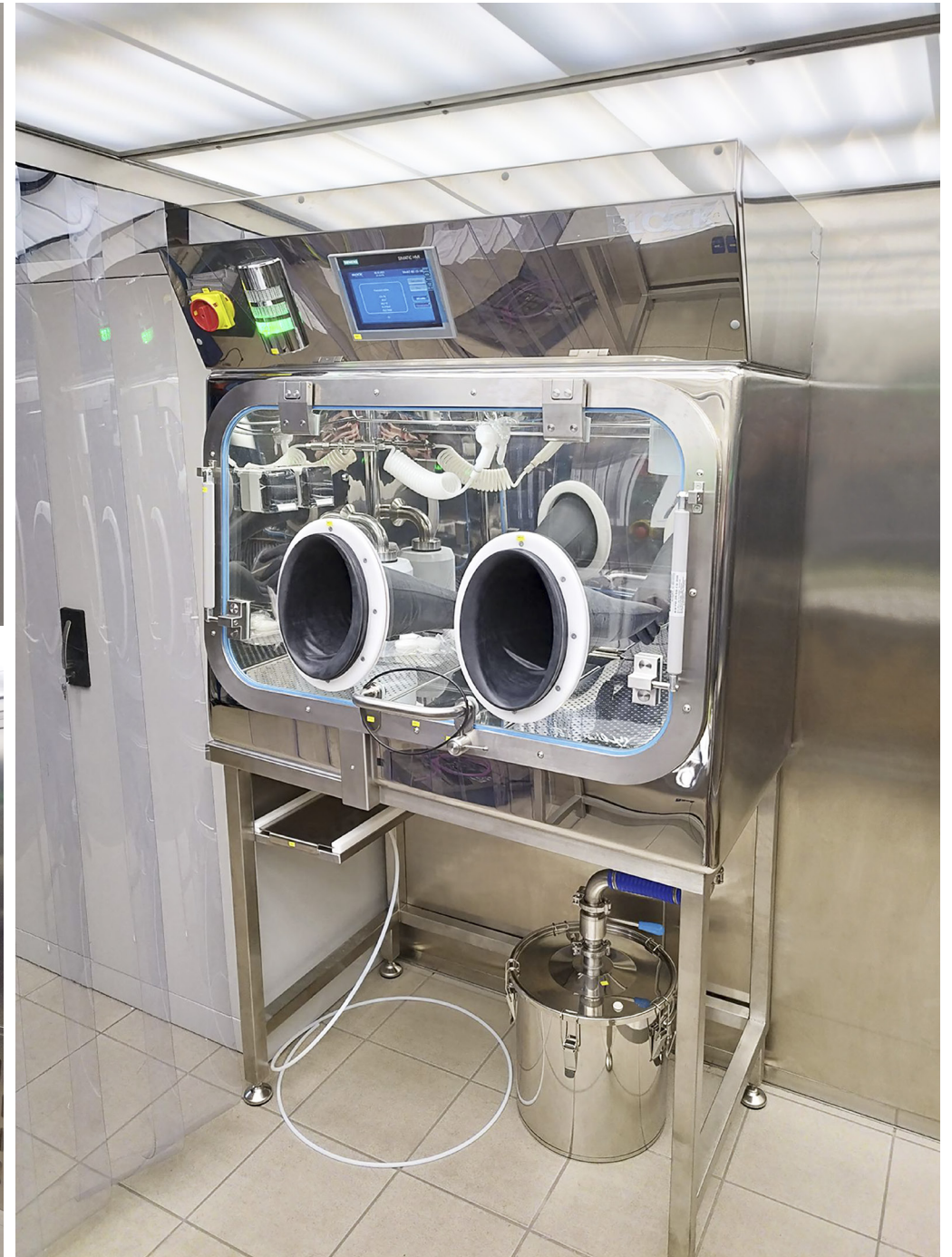
Weighing Isolator | Synthon, s.r.o. | Czech Republic