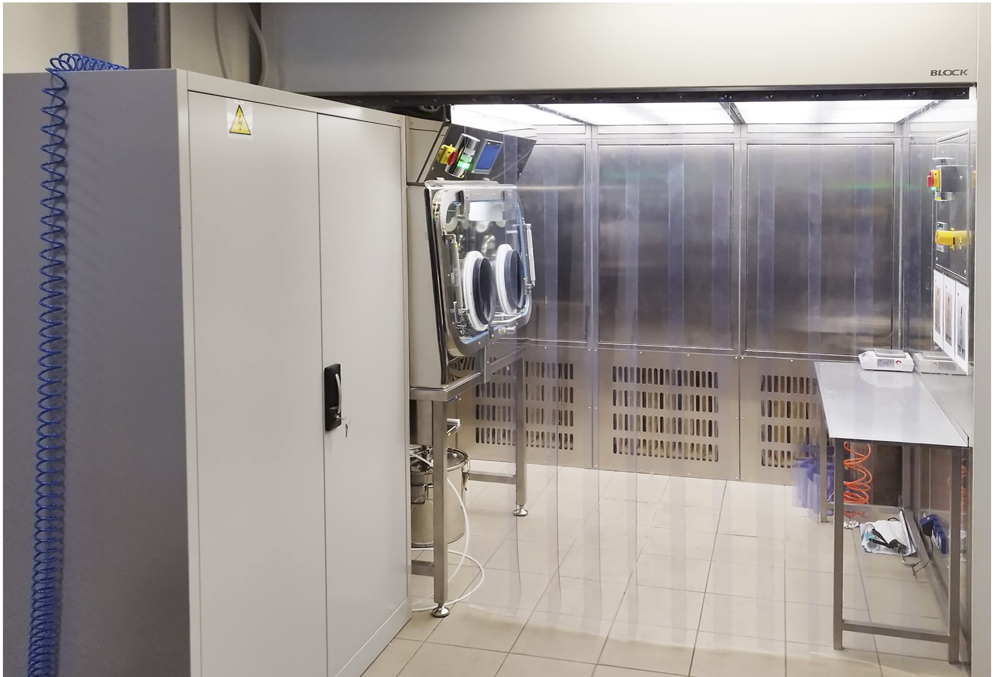
Weighing Isolator | Synthon, s.r.o. | Czech Republic