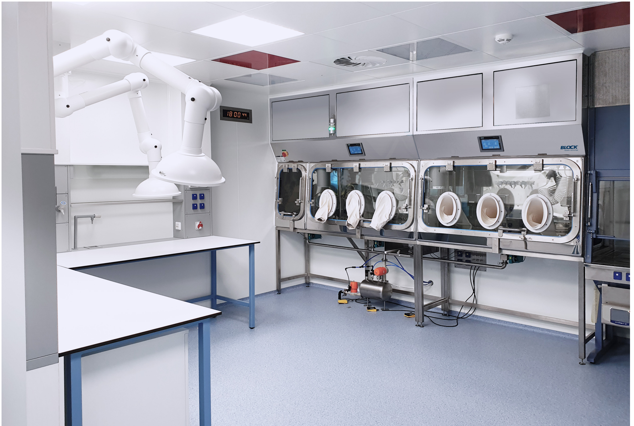
Isolator workplace | Synthon, s.r.o. | Czech Republic